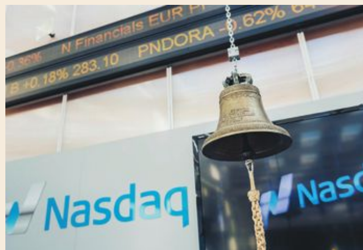
Ledarna för börsens bolag ogillar politisk osäkerhet.

– Det absolut viktigaste för börsbolagen är förutsägbarhet. Men det finns så många frågor nu som innebär oklarheter, som beskattning av finanssektorn, vinsttak inom vårdsektorn och skattereglerna för fåmansbolag. Näringslivet hatar risk, säger han.