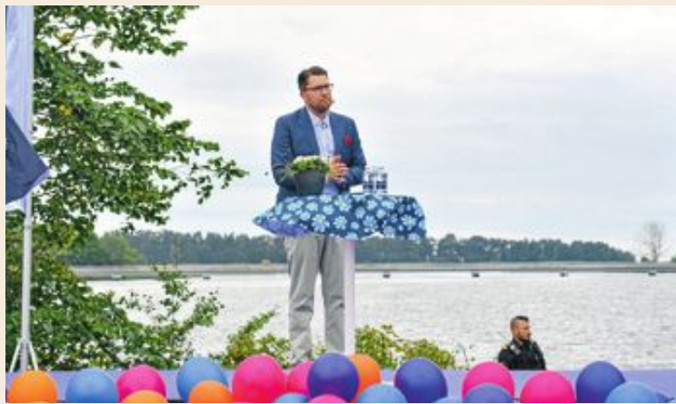
Småföretagare gillar Jimmie Åkesson (SD)

Egenföretagarnas sympatier med Socialdemokraterna ligger betydligt lägre än för hela befolkningen, bara knappt 13 procent har angett S som första val, mot drygt 29 procent för gruppen totalt.