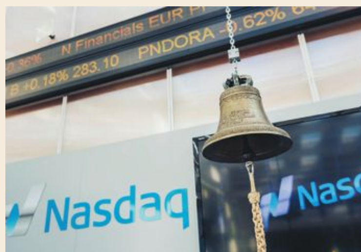
Ledarna för börsens bolag ogillar politisk osäkerhet.

– Det absolut viktigaste för börsbolagen är förutsägbarhet. Men det finns så många frågor nu som innebär oklarheter, som beskattning av finanssektorn, vinsttak inom vårdsektorn och skattereglerna för fåmansbolag. Näringslivet hatar risk, säger han.