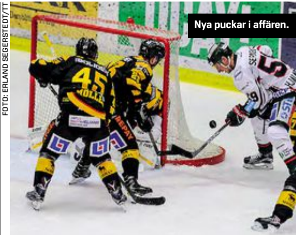
Nya puckar i affären.

Redaktör HANS PERKIÖ hp@dagenssamhalle.se • 08-452 73 32